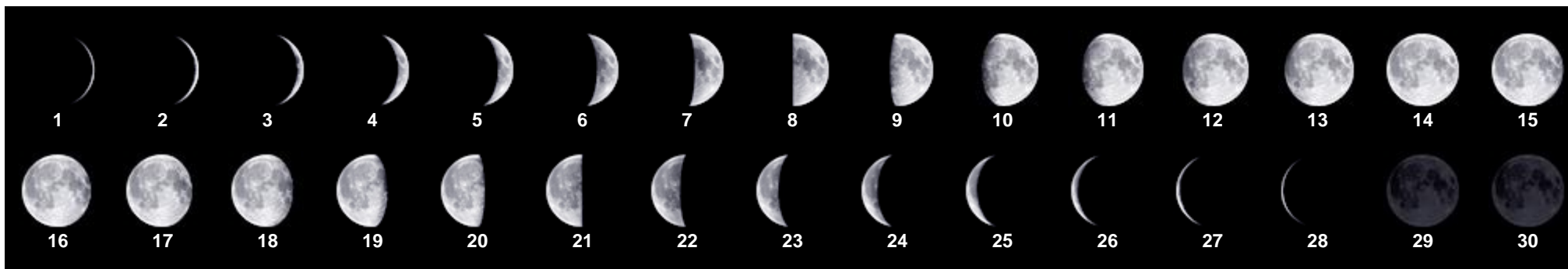
Der biblische Monat beginnt immer bei Neulicht (erste sichtbare Mondsichel über Jerusalem) und hat entweder 29 oder 30 Tage